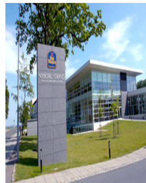
Gå ikke glip af årets evalueringskonference der afholdes d. 10.–12. september 2009 på Hotel Nyborg Strand.

Et kortfattet program for konferencen vil blive offentliggjort i næste nummer af nyhedsbrevet, der udkommer i maj måned.